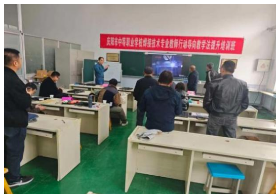
图 21 行动导向教学法提升培训暨焊接技术专业教师技能竞赛培训班