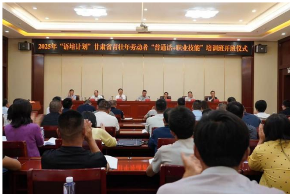
图 10 “普通话+职业技能”培训班开班式

为期 3 个月的第 8 期焊工技能培训班，培训高级焊工 20 名。自 2018 年中国化学工程集团有限公司在环县职专挂牌成立培训基地以来，已连续举办 8 期焊工培训班，累计输送 265 名低收入家庭未就业适龄青年到中国化学工程集团所属建设公司实现稳定就业，人均月工资 8000 元以上，改变了部分家庭贫困落后的精神面貌，激发了群众向上向好的内生动力，增强了致富奔小康的信心，为环县、华池县巩固拓展脱贫攻坚成果同乡村振兴有效衔接做出了积极贡献。