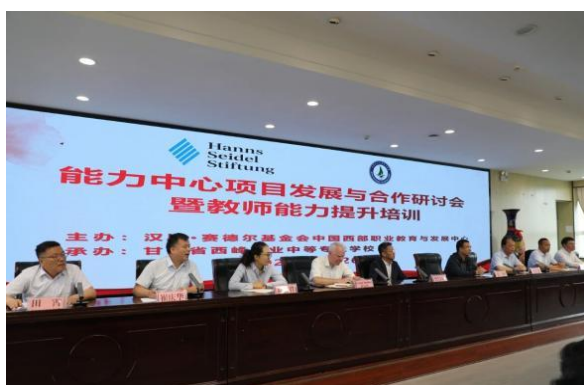
图 20 汉斯赛德尔基金会能力中心项目合作研讨会在西峰职业中专顺利召开

教改等方面给予学校大力支持，为学校高质量发展注入强劲动力，助推教研教改工作取得丰硕成果。学校创新构建“中德-校企-校校”三方合作模式，成立职业教育综合学科教研中心，深入实施名师工程与“三优+”工程，将相关经验做法在全省推广；牵头联合多所职业学校组建“优质学校+”研修共同体，引领建设共享型职业教育教学改革共同体，有力推动区域内职业教育协同发展。2025 年内召开德国汉斯·赛德尔基金会能力中心项目发展与合作研讨会，开展“行动导向教学法专题培训班”3 期，培训教师 24 人次。