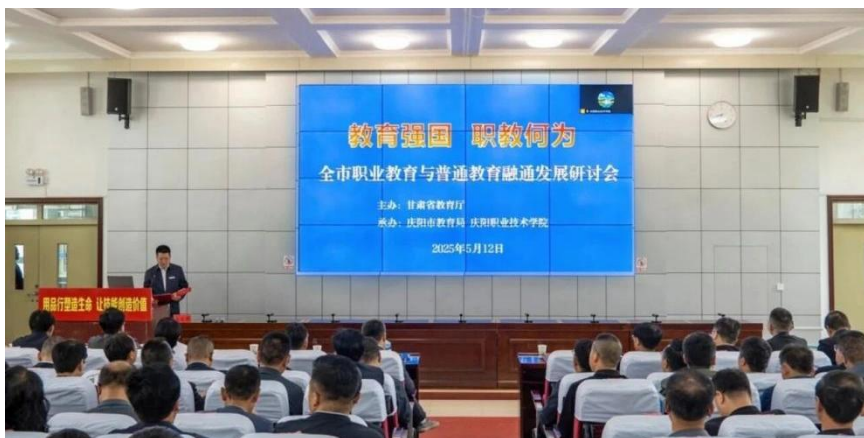
图 15 职业教育活动周期间在庆阳职业技术学院开展职普融通发展研讨

创新思政教育模式，将劳模精神、劳动精神、工匠精神深度融入“大思政课”体系。市内各中职学校深入开展“未来工匠”读书行动、劳模工匠进校园等“技能成才 强国有我”系列育人活动，邀请各行业劳模工匠开展事迹报告、技能展示等活动，为新生讲好“入学第一课”，为学生讲好“匠人匠心”行业故事，引导激励学生勇敢逐梦、技能成才。成功举办 2025 年职业教育活动周，统筹部署“七个主题日”活动，组织开展职教发展研讨、职业启蒙体验、校企合作实践、职教出海教学法培训、技能风采巡回展、志愿服务进社区、电商直播助农进农田、非遗传承进校园等职教宣传活动，携手市融媒体中心制作发布“点亮美好教育——产教融合 技能成才 庆阳书写中职教育新篇章”节目，对全国全省职业教育政策和全市职业教育发展成果、先进典型进行了多方位、广视角宣传，持续增强职业认知，培育劳动观念。全市活动周相关情况被央视频、甘肃省教育厅视频号等媒体转发报道。