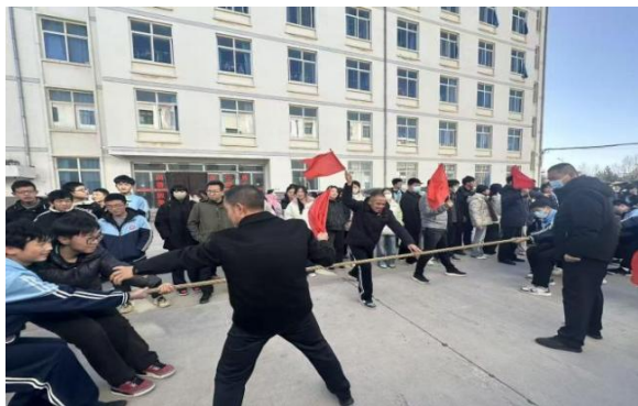
图 6 学生运动会拔河