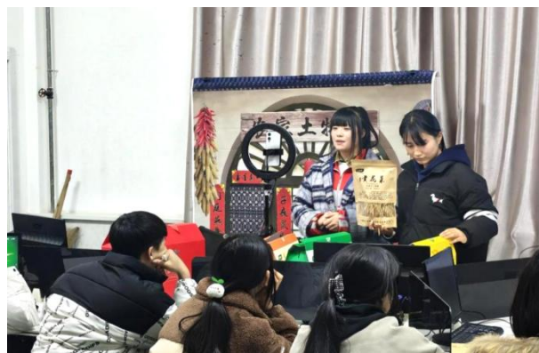
图9 农产品直播运营