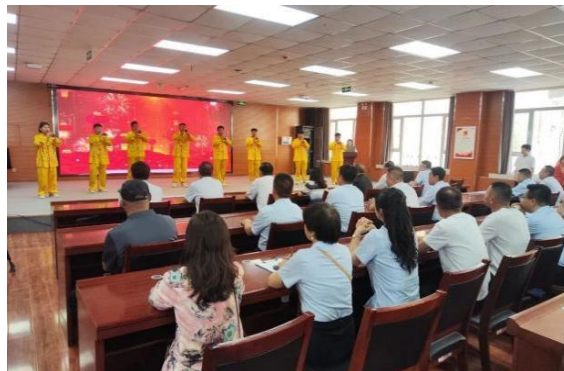
图 7 唢呐社团音乐展示