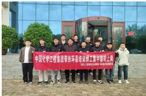
图 11 第 8 期焊工输转上岗前留影