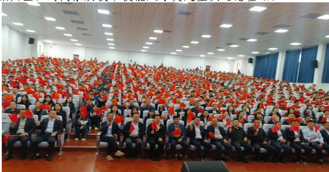
图 16 组织师生集体观看阅兵仪式

紧密结合地域红色资源优势，依托“红润庆阳”品牌，坚持将红色教育融入育人全过程，构建“课程教学+实践体验+文化浸润”的立体化教育模式。积极推动红色资源与校园文化深度融合，将南梁精神等本土红色文化有机融入思政课程与专业教学，引导学生系统学习革命历史；持续拓展红色教育实践平台，与本地红色教育基地建立长效合作关系，开展“红色故事会”、重走红军路、参观革命遗址等主题教育活动，并邀请退伍军人、老党员等进校园宣讲，使红色基因深植学生心灵。依托五四、七一、八一、国庆等重要纪念日，组织开展“红色经典诵读”“革命歌曲传唱”“爱国主题征文”等形式多样的竞赛活动，同步推进学雷锋志愿服务、团员志愿活动等实践项目，引导中职学生在沉浸式体验中深刻感悟红色精神，自觉把个人理想追求融入国家发展大局，为培养德技并修、担当老区振兴重任的高素质技术技能人才奠定坚实思想基础。