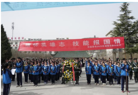
图17 赴烈士陵园清明节祭扫活动