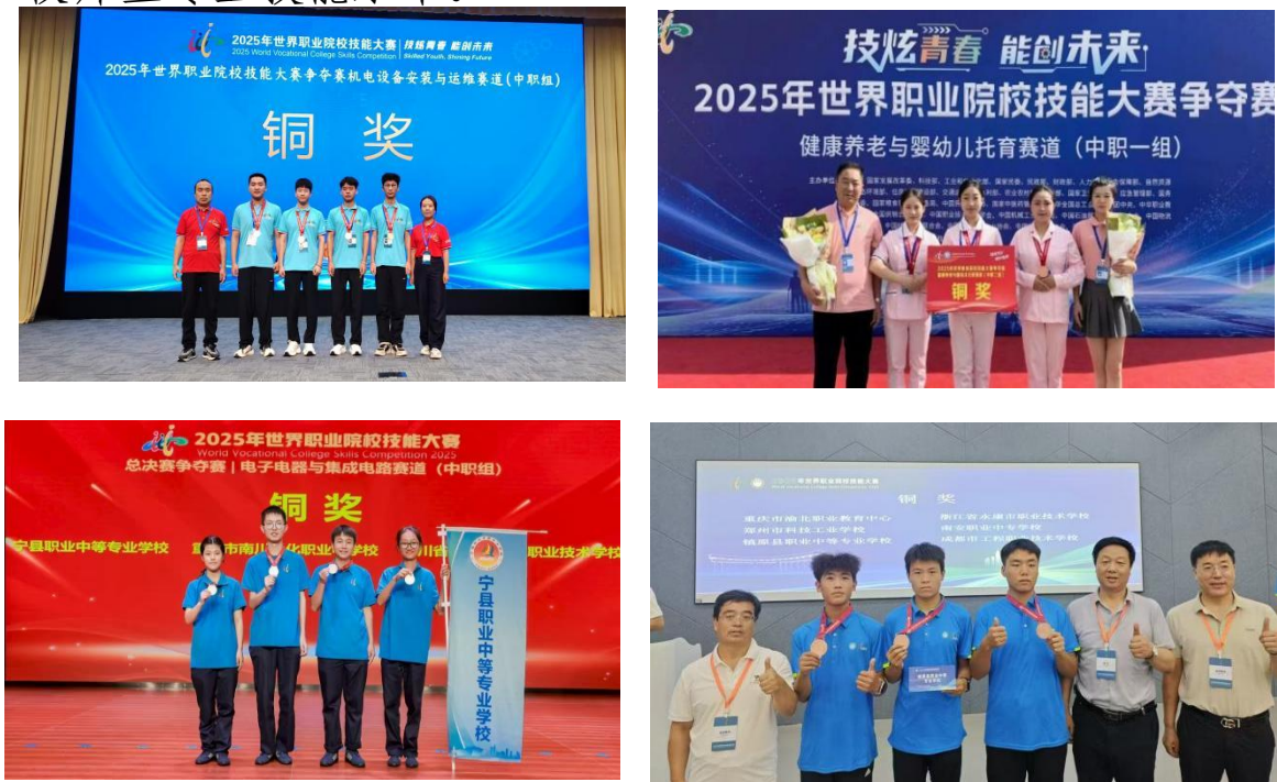
图 2 2025 年世界职业院校技能大赛争夺赛获奖情况

87 个团队参与 2026 年甘肃省职业院校技能大赛。依托德国汉斯·赛德尔基金会培训项目，在西峰职专举办全市中职学校焊接技术专业教师技能竞赛”，评选出一等奖 2 名，二等奖 3 名，三等奖 5 名。通过开展各类技能大赛，提升了全市职业学校师生专业技能水平。