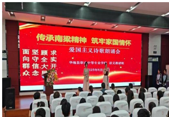
图18 爱国主义诗歌朗诵活动