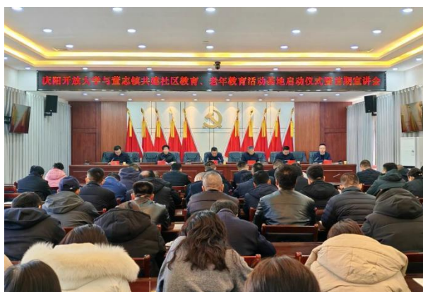
图 13 庆阳开放大学与董志镇共建实践基地