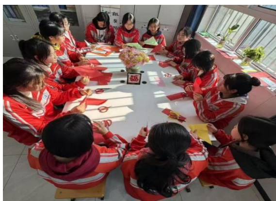
图 4 剪纸社团活动场景

坚持以学生成才为目标，丰富成才渠道和网络，积极贯通中高职一体化“立交桥”，2025 年 11 所中职学校与 21 所高职、本科院校共招收贯通培养学生 3185 人（“3+2”中高职贯通培养项目招生 3155 人、“3+4”中本贯通培养项目招生 30 人），贯通培养招生数达到招生总数的 70%。深化职普融通试点改革，2025 届职普融通试点班毕业学生 609 人，本科上线率 18.72%；2025 年职普融通实验班招生 295 人，推动职业教育与普通教育横向融通。注重学生综合素质培养与个性潜能挖掘，持续开展技能传承中华优秀传统文化、劳模工匠进校园等“技能成才强国有我”系列活动，各校广泛开设涵盖文化艺术、科技创新、体育健康、社会实践等各类学生社团，并定期举办丰富多彩的体育竞赛、艺术展演、技能文化节等活动，有力促进学生身心健康、审美素养、团队协作与创新实践能力的整体提升，为学生搭建展示自我、锻炼能力、全面成长的多元舞台。