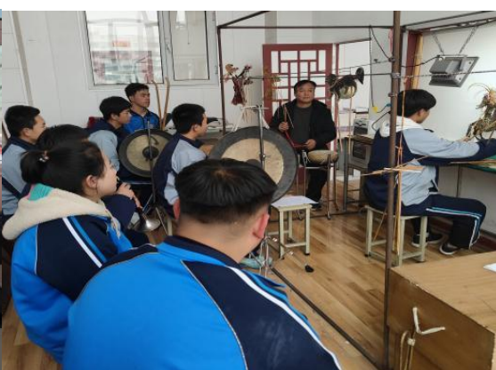
图 5 学生进行道情皮影演出