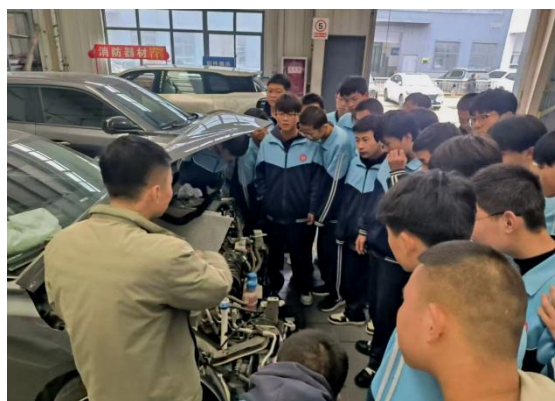
图 23 汽修专业师生赴市内 4S 店参观学习