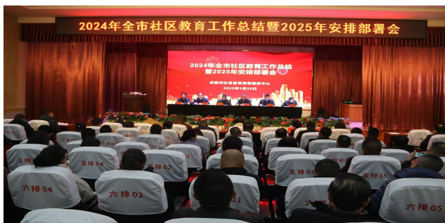
图 12 召开全市社区教育工作总结暨安排部署会议

项目被确定为 2025 年甘肃省“终身学习品牌项目”。丰富老年教育办学资源，庆阳开放大学中老年学习培训班开设书法、国画、声乐、诵读、舞蹈、篆刻、电子琴、摄影等 8 个专业教学班，招收中老年学员 550 余人，2025 年新成立合水、华池、正宁老年开放大学，开设书法绘画、合唱舞蹈、太极拳等特色专业课程，招收学员 248 人，庆阳开放大学与西峰区董志镇共建社区教育、老年教育活动基地，满足中老年人日益增长的精神文化和多样化的学习需求，老年班学员在全市教育系统“丹青绘风骨 翰墨铸师魂”主题书画展中踊跃投稿，实现了老有所教、老有所学、老有所为、老有所乐。