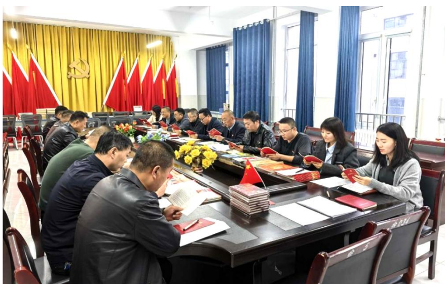
图 25 主题党日活动