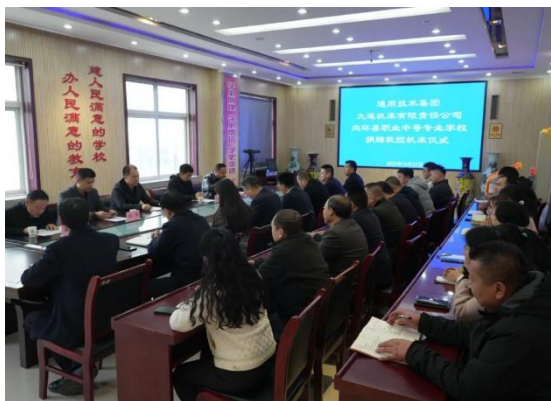
图 22 大连机床向环县职专捐赠设备

“星火照护班” “海事班” “大金班” “中医康复班” “美容美体班”等订单培养，其他中职学校与域内汽修厂、养老服务中心、养殖场、园林公司等中小微企业长期合作开展实习实训合作典范，促进了实践教学和学生就业创业。全市校企合作工作成效明显，合作领域和形式日趋多元化，范围不断扩大，师资质量有效提高，专业结构得到优化，教学改革进一步推进，校企合作互惠互利、合作共赢的态势向好发展。