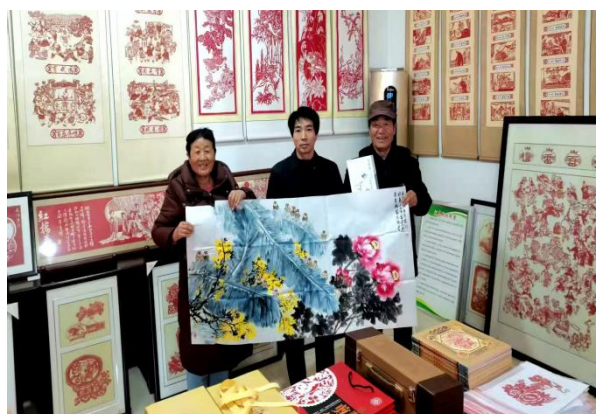
图 14 社区教育基地书画交流展示